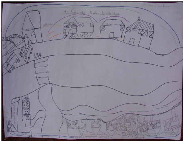
Figura 1: Mapa de Riesgo 1

Para lograr lo anterior se le solicitó a las personas participantes que en forma individual dibujaran su comunidad en un papelógrafo blanco y que con ayuda de una simbología de riesgos 1 identificaran en el mapa si existían algunas o todas de estas problemáticas, para lo cual debían señalar con un círculo -del color correspondiente- el lugar de incidencia de dicha situación.